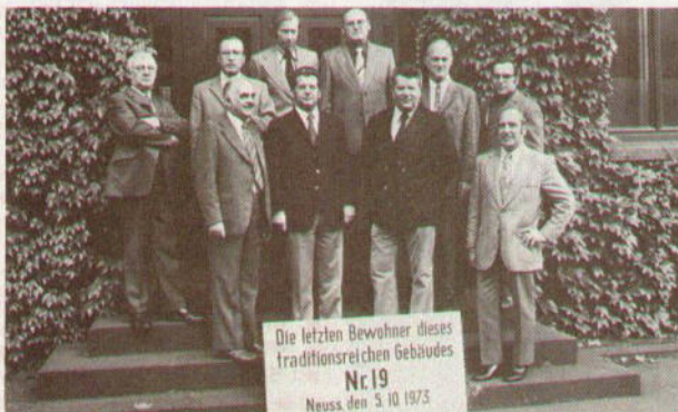
Die letzten Bewohner dieses traditionsreichen Gebäudes Nr. 19 Neuss den 5. 10. 1973

In unseren Archiven stöberten wir ein Foto auf, das 1913 kurz nach der Einweihung „geschossen“ wurde. Inzwischen hat sich viel geändert. Das neue Gebäude stellte damals gleichzeitig den Beginn für das heute fast 5.000 Mitarbeiter zählende Unternehmen dar und für den Erfolg, den die Erzeugnisse der deutschen IH-Gesellschaft heute weltweit haben. Und nun die letzten Bewohner, die sich am 5. 10. 73 vor dem Portal postierten. Es ist der Stab, der heute für die Produktion verantwortlich ist und die Aufgabe übernommen hat, das Erbe weiterzuführen und den Erfolg auszubauen.