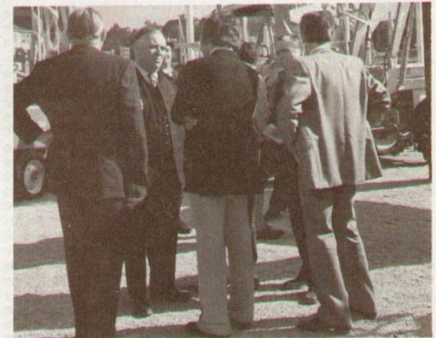
Impressum: IH Informationen. Interner Informationsdienst für alle Mitarbeiter der deutschen IH-Gesellschaft, Neuss am Rhein, Industriestraße 39. Herausgegeben von der Werbeabteilung. Redaktion: G. Blaesser.

Alles in allem dürften die Besucher, ebenso wie die Aussteller und Hersteller über den Verlauf der Ausstellung zufrieden sein und gespannt auf das nächste, in 2 Jahren stattfindende, Bayerische Zentral-Landwirtschaftsfest in München blicken, das sich immer mehr – auch über den bayerischen Raum hinaus – zu einem Schwerpunkt der deutschen landtechnischen Ausstellungen entwickelt hat.