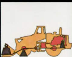
PAYloader verfügen über eine perfekte Gewichtsverteilung.