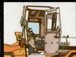
Die Sicherheitskabinen sind sehr komfortabel und bedienungsfreundlich.