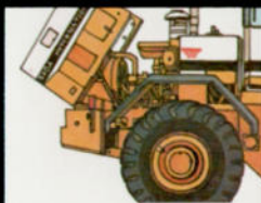
Bei fünf PAYloadertypen kann die Motorhaube einfach hochgeklappt werden.