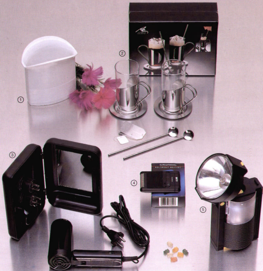
① WG 250 Blumenvase „Calypso“ aus dem Hause Seltmann, Weiden