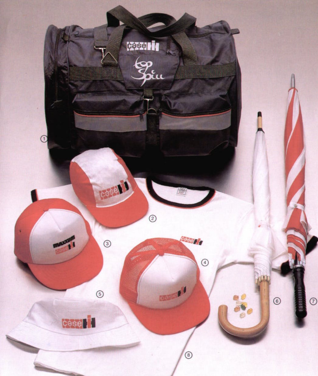
① WG 265 Sporttasche Nylon, für Reise und Freizeit, Größe ca. 59,5 x 32,5 x 35 cm