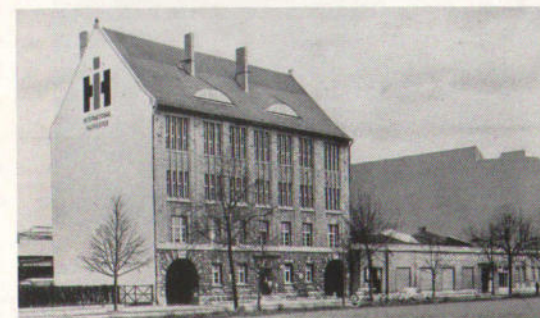
Die IH-Niederlassung in Berlin-Tempelhof wurde während der „Grünen Woche“ von Hunderten von Landwirten aus der Ostzone besucht.

Die Pressestelle der Berliner Ausstellungen hat in einer Pressenotiz vom 5. Februar darauf hingewiesen, daß eine bekannte Firma auf ihrem Stand den Besuch von rund 250 alten Kunden des Landmaschinenhandels aus der Ostzone registrieren konnte. Es war der IH-Stand, der diese Feststellungen getroffen hat. Unter den vielen sonstigen Besuchern befand sich beispielsweise auch ein mitteldeutscher Bauer, der früher auf seinem Hof vorzugsweise McCORMICK-Maschinen einsetzte und der nun unbedingt einen Kaufvertrag über einen DF-Dieselschlepper mit der Bedingung abschließen wollte, daß er der erste sein solle, der nach der Wiedervereinigung Deutschlands eine solche Maschine erhält. Solche schönen Zeichen alter Kundentreue bestärken uns in dem Gefühl, daß der Entschluß, uns an der „Grünen Woche Berlin“ zu beteiligen, richtig war.